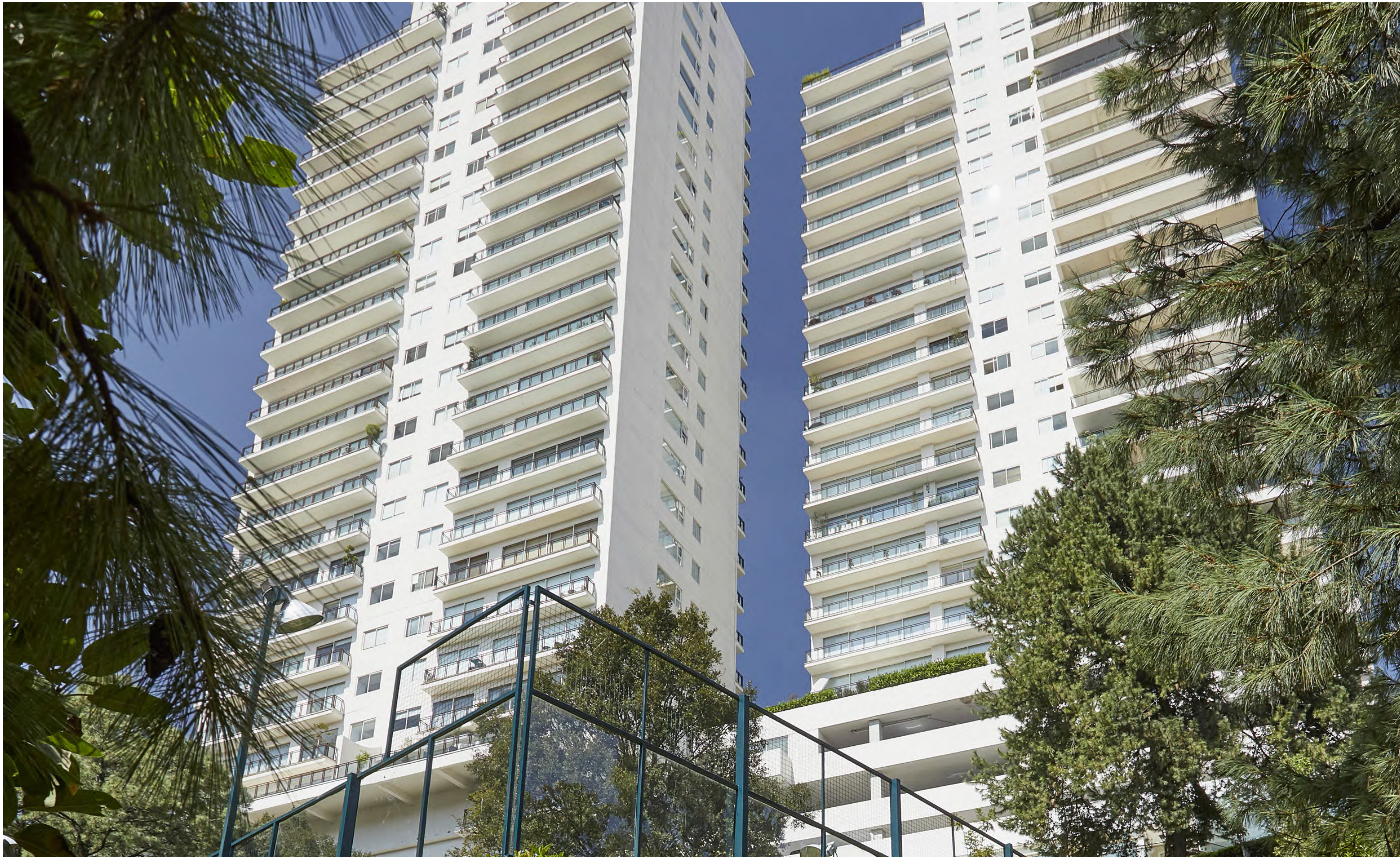
CUMBRES DE SANTA FE