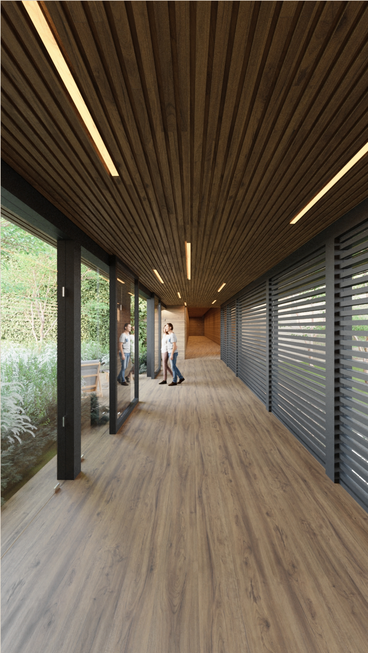
CUMBRES DE SANTA FE