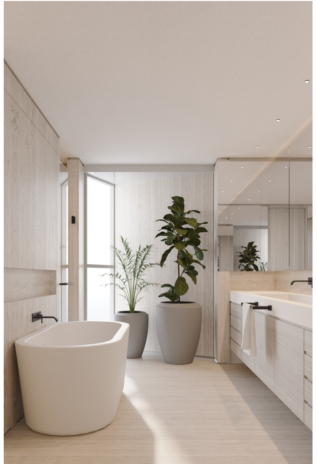
ENCINAR TORRES GIRAULT "B Y C"