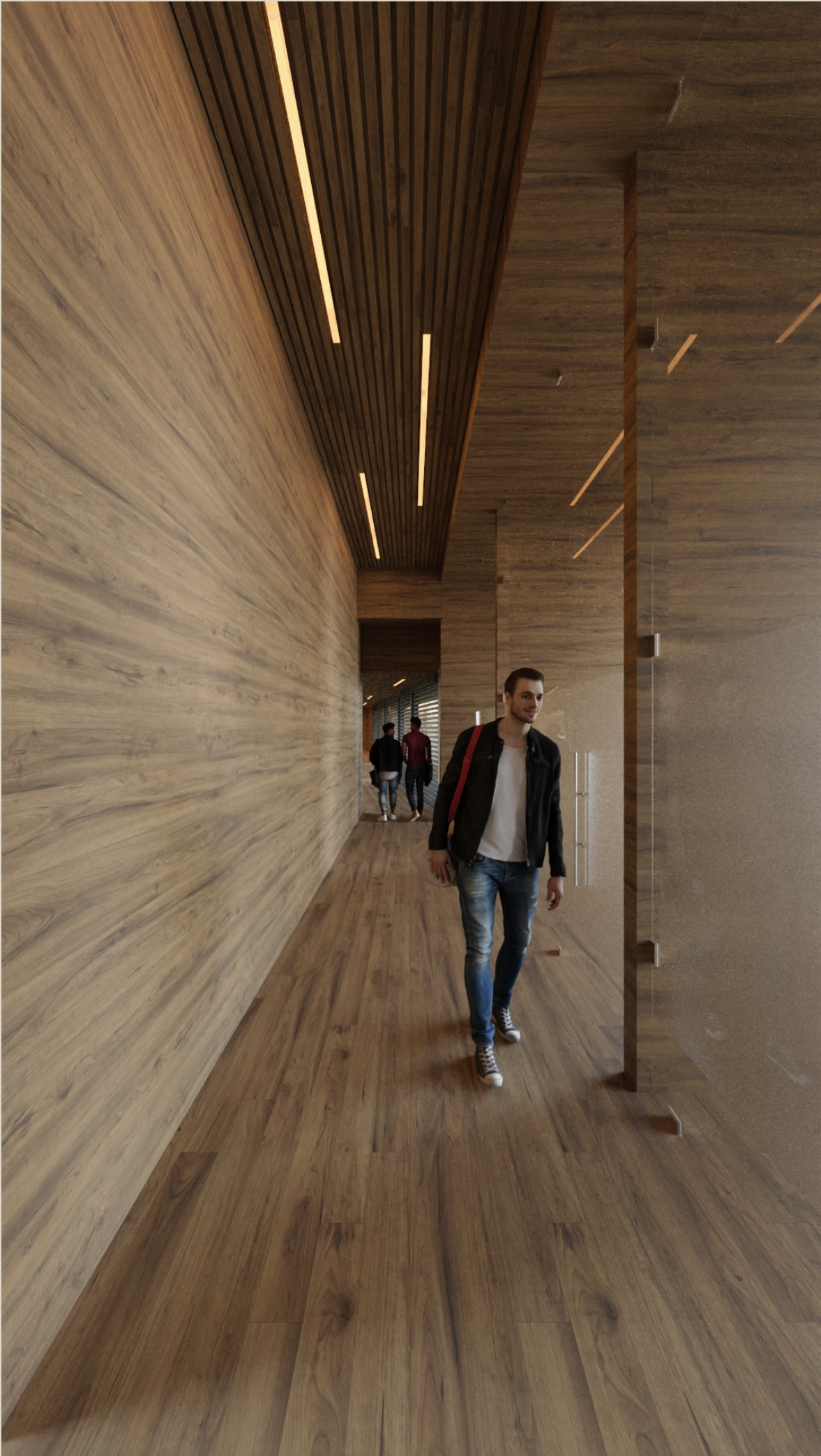
CUMBRES DE SANTA FE