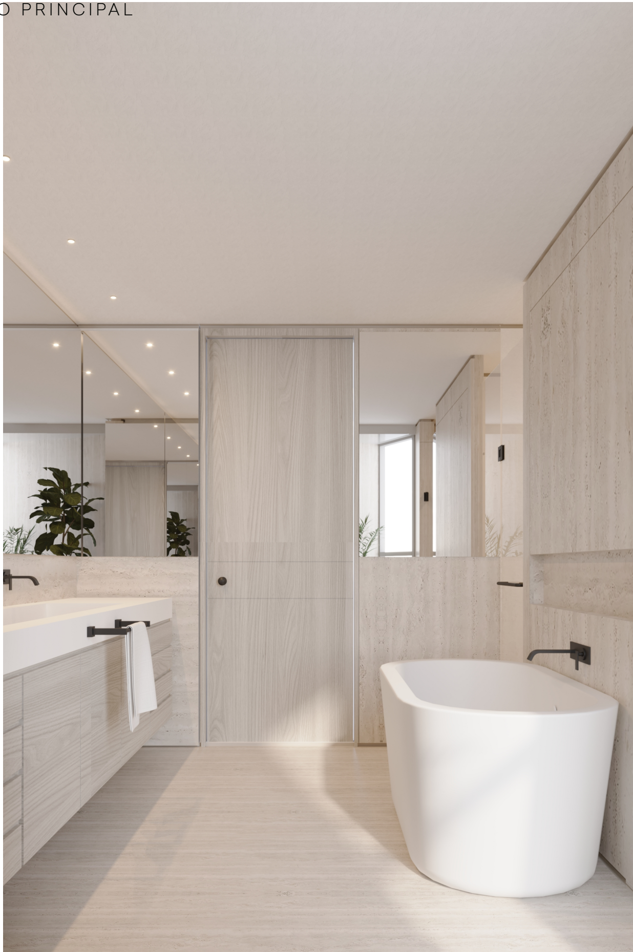
CUMBRES DE SANTA FE