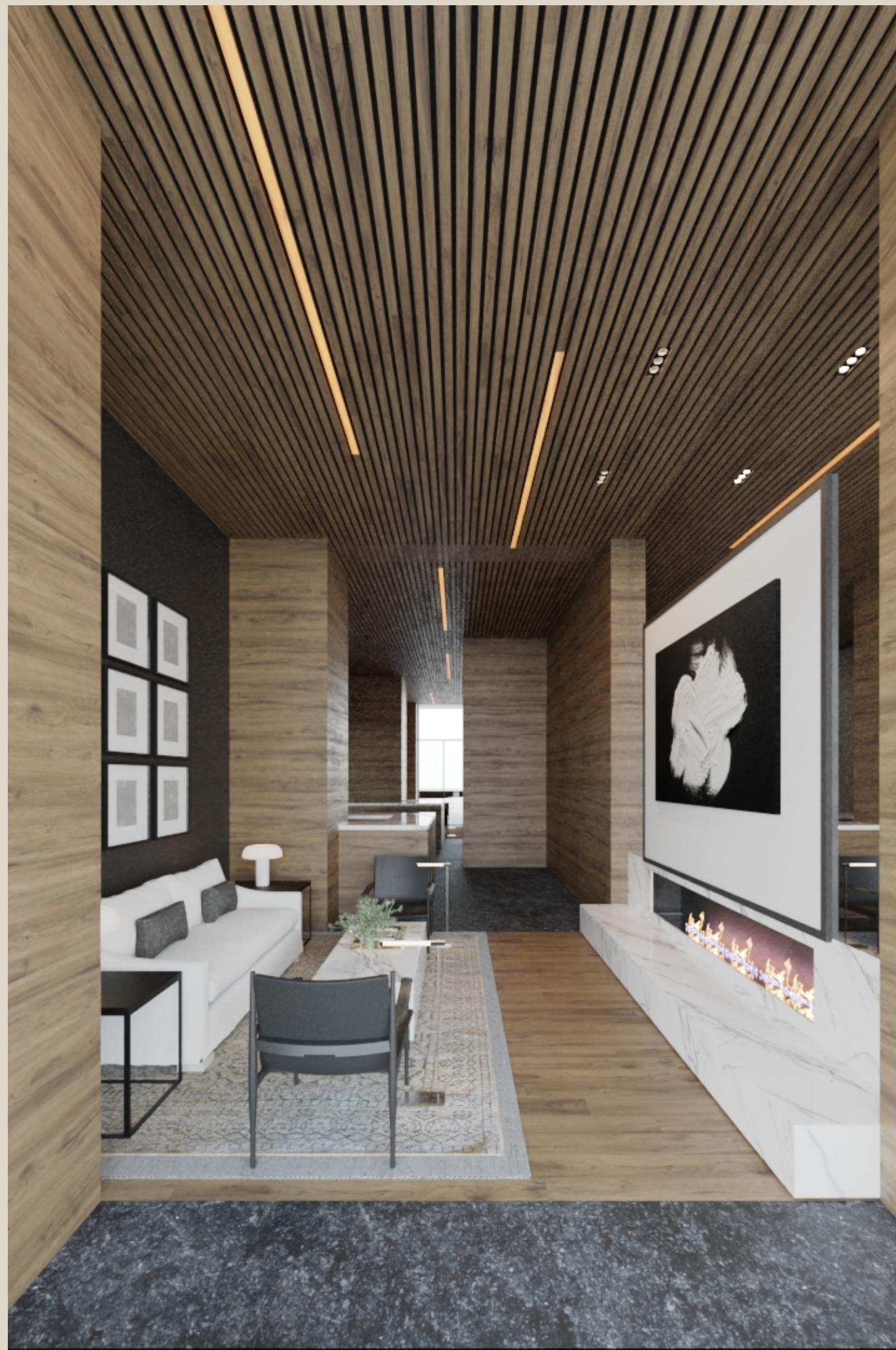
CUMBRES DE SANTA FE