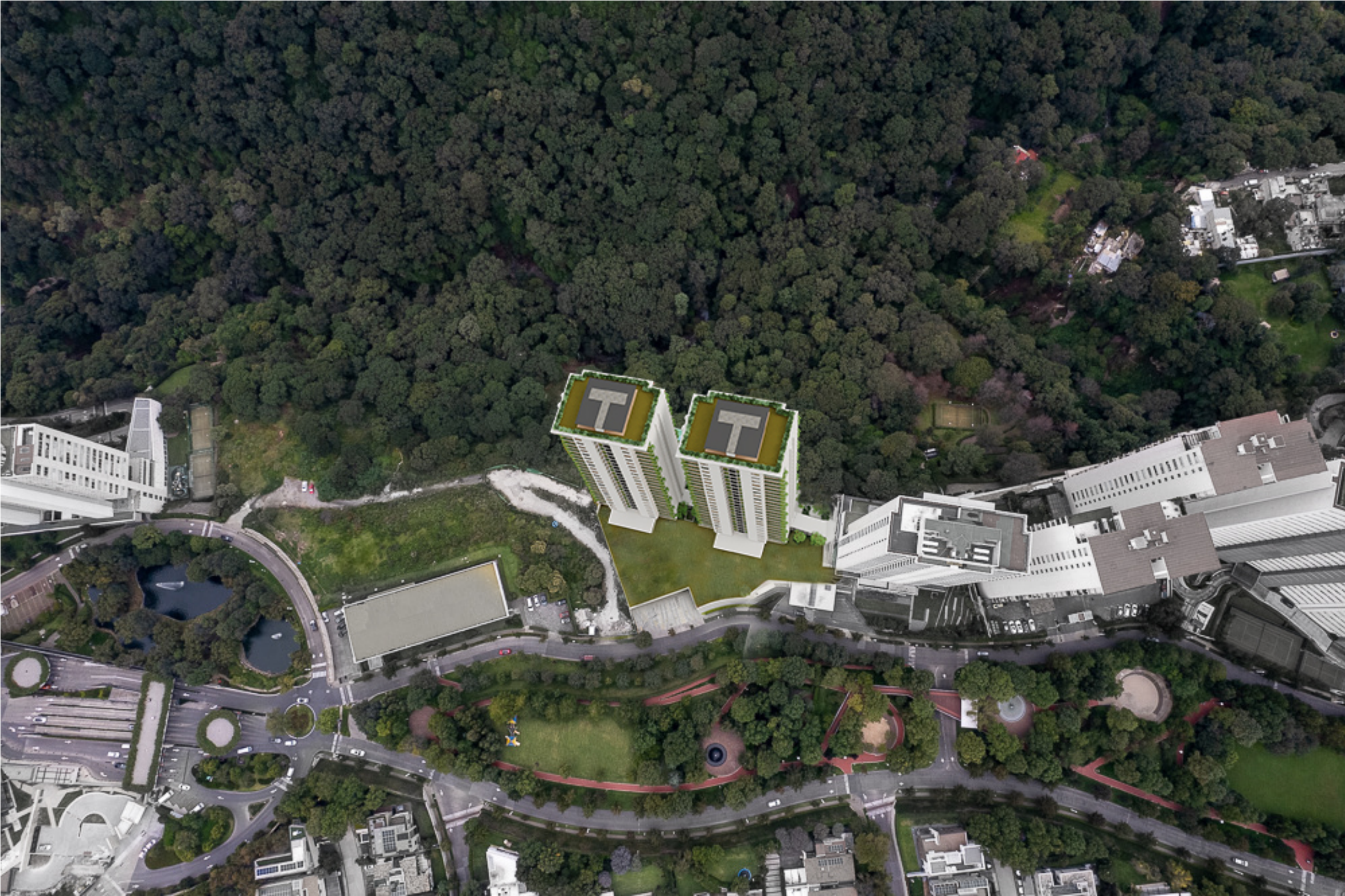
CUMBRES DE SANTA FE